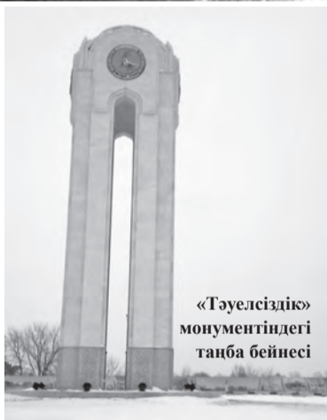
«Тәуелсіздік» монументіндегі таңба бейнесі