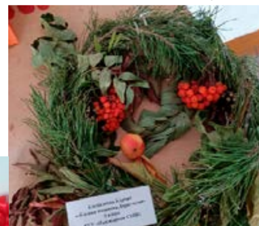
Клейносова Карина Дары осени 5 б класс