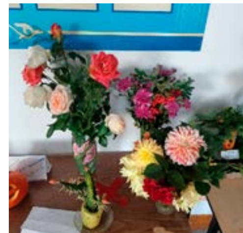
Яркие цветочные композиции