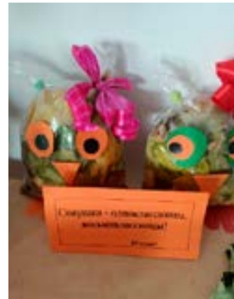
Совушки - одноклассницы 8 б класс