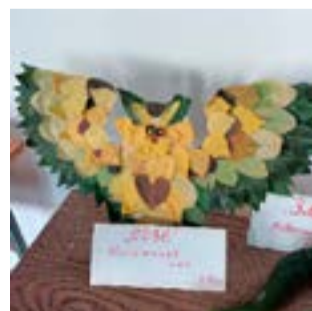
Такижанов Али Сова 3 б кл