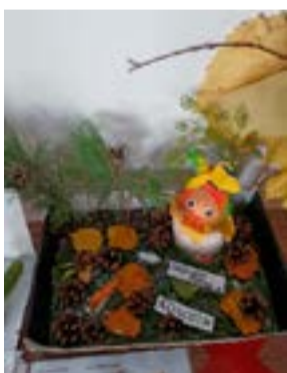
Павлюк Фрида Колобок 0 кл