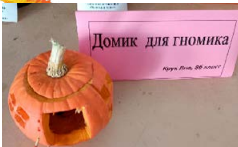
Домик для гнома Крук Яна 8 б класс