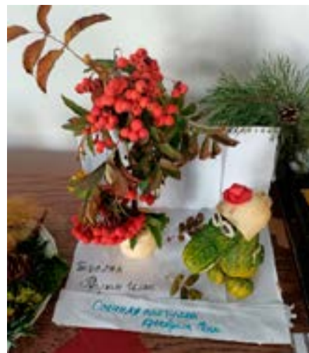
Бечелов Руслан 16 кл Осенняя прогулка крокодила Гены