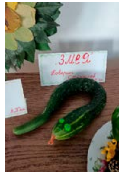
Каверин Станислав Змея 3 б класс