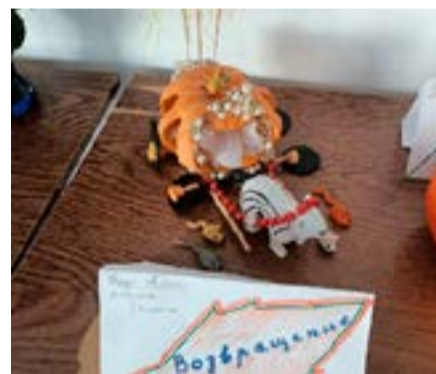
Крук Алина Возвращение 6 б кл