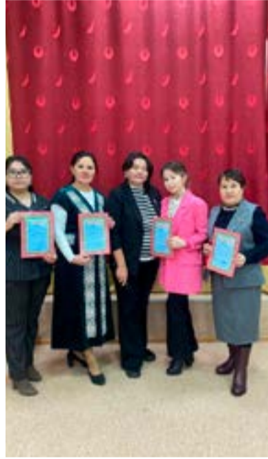
тур районного конкурса «Үздік аға тәлімгер».

Согласно плану работы методического кабинета отдела образования проведен отборочный